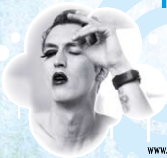
Figure de la scène alternative portugaise, The Legendary Tigerman, alias Paulo Furtado, est un mordu de blues et de rock primitif. Chanteur-compositeur, multi-instrumentaliste, il distille un blues d'un autre genre dont la voix est claire et les arrangements sobrement envoûtants. Sa musique est planante, créant une atmosphère singulière, chargée d'émotions dans laquelle l'emballement électrique prend une place forte.